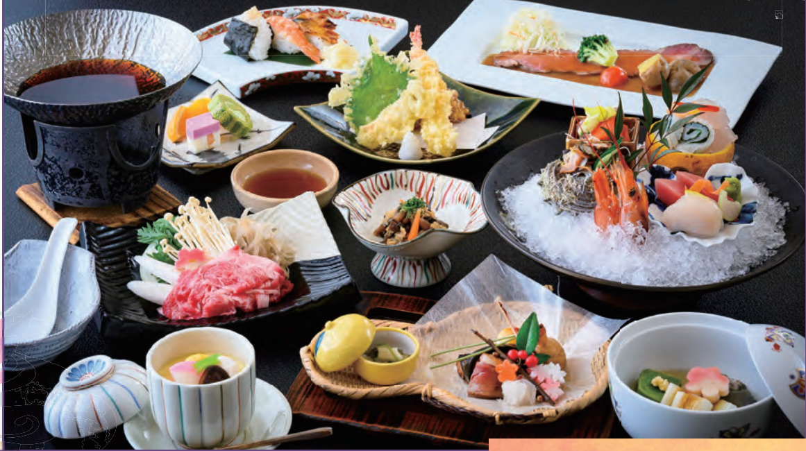
※左写真は「松コース」でございます